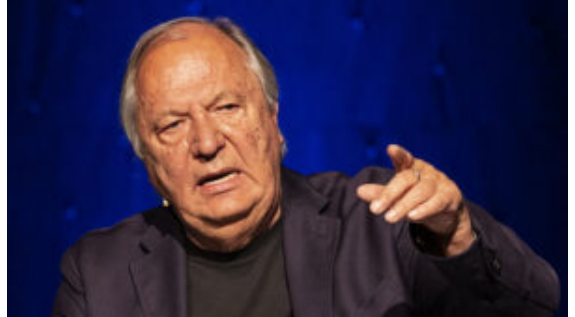
Wilfried Schmickler.

Die geplante Kabarettveranstaltung mit Wilfried Schmickler am kommenden Freitag, den 24.10.2025 in Bergkamen kann krankheitsbedingt nicht stattfinden.