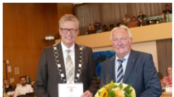
Bürgermeister Bernd Schäfer