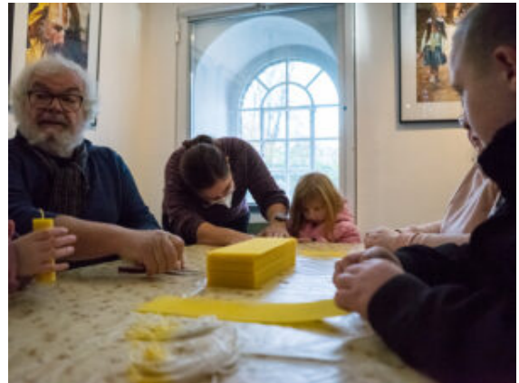
Bienenwachs verwandelt sich in Kerzen.

Weidenzweige schneiden ist gar nicht so leicht. Sie erst einmal vom Anhänger zu bekommen und die biegsamen Zweige genau dort unter die Astschere zu legen, wo sie hinsollen: Für viele eine Premiere. Bienenwachs zu Kerzen rollen, Wolle mit Seife in Filz verwandeln oder aus Holz, Stöckchen und Farbe kleine Lebewesen formen: Beim Familientag auf der Ökologiestation ging es ganz nah heran an die Naturmaterialien.