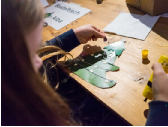
Abi Alba als Bastel- Andenken.