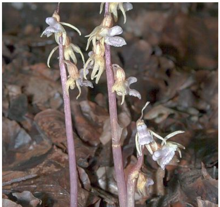
Widerbart ( Epipogium aphyllum ).

Die einheimischen Orchideen stehen am Samstag, 26. November, im Mittelpunkt, wenn sich die Mitarbeiterinnen und Mitarbeiter des „Arbeitskreises Heimische Orchideen (AHO) NRW“ in der Ökologiestation in Bergkamen-Heil treffen.