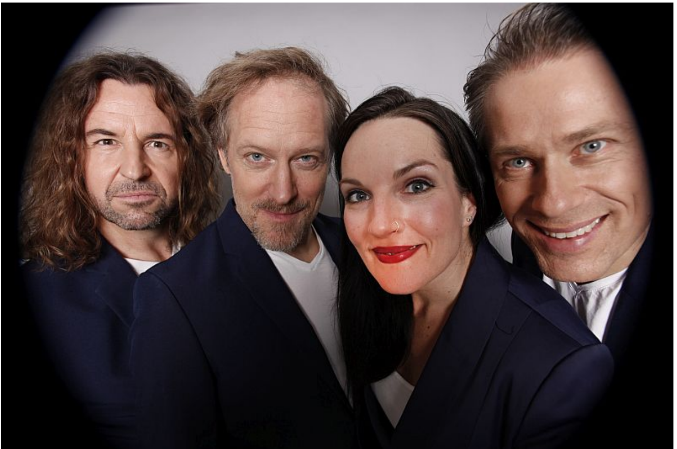
LaLeLu, Foto: Mathias Knoppe

A-cappella der Extraklasse mit der Gruppe LaLeLu gibt es am Freitag, den 24.05.2024 um 20.00 Uhr auf der Bühne im studio theater bergkamen.