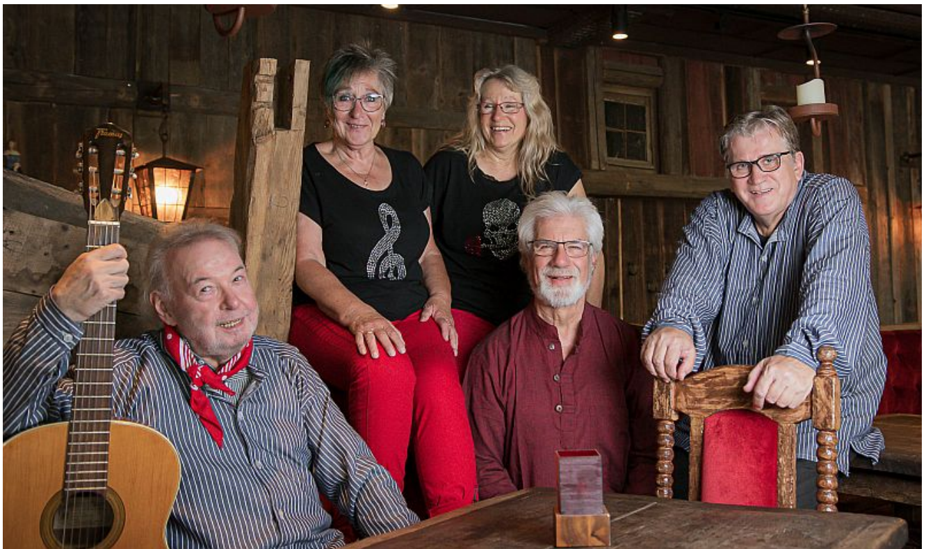
Die Band „Klabauter & Co.

Am Montag, 9. Januar, ab 16 Uhr bietet der Gesprächskreis „Pflegerische Angehörige“ Bergkamen eine Mitmach- und