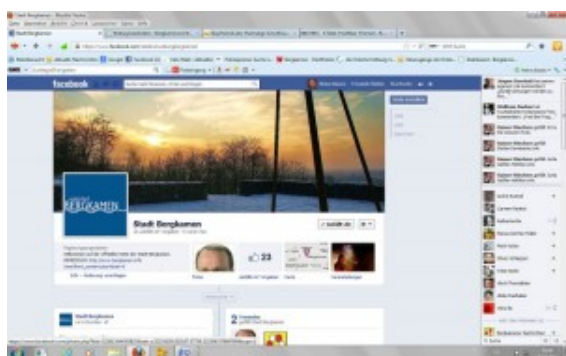
Offizielle Facebook-Seite der Stadt Bergkamen

Lange hat sich ja die Rathaus spitze geziert, doch jetzt ist es passiert: Die Stadt Bergkamen hat eine eigene „offizielle“ Facebookseite. Am Montagmorgen ist sie an den Start gegangen. Das Titelbild ist eine Winterimpression von der Bastion auf der Ader Höhe mit Blick auf die untergehende Sonne.