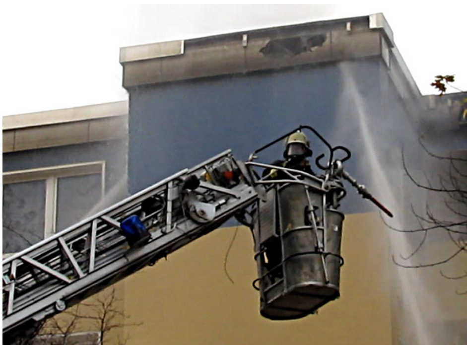
Mehrfamilienhauses an der Gedächtnisstraße im Dezember 2012

„Wo sind denn eigentlich eure Schlafräume?“ Mit dieser Frage werden die Bergkamener Feuerwehrleute häufig konfrontiert, wenn ihre Gerätehäuser, etwa an „Tagen der offenen Tür“ von Menschen besucht werden.