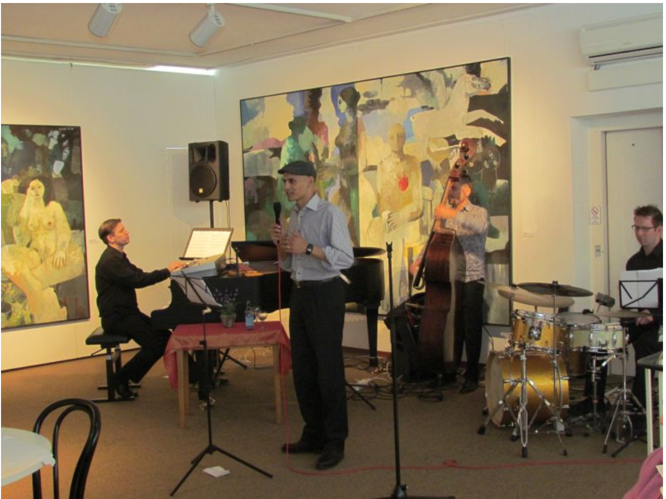
Haryo Sedhono Group