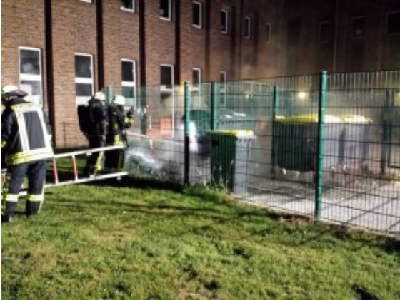
Containerbrand am Schacht IIIII.

In der Nacht zum Sonntag wurde die Feuerwehr Rünthe um 1.18 Uhr zu einem Containerbrand an der Begegnungsstätte Schacht III gerufen. Möglicherweise lag hier Brandstiftung vor.