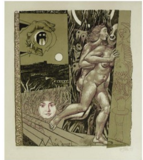
Grafik von Willi Sitte