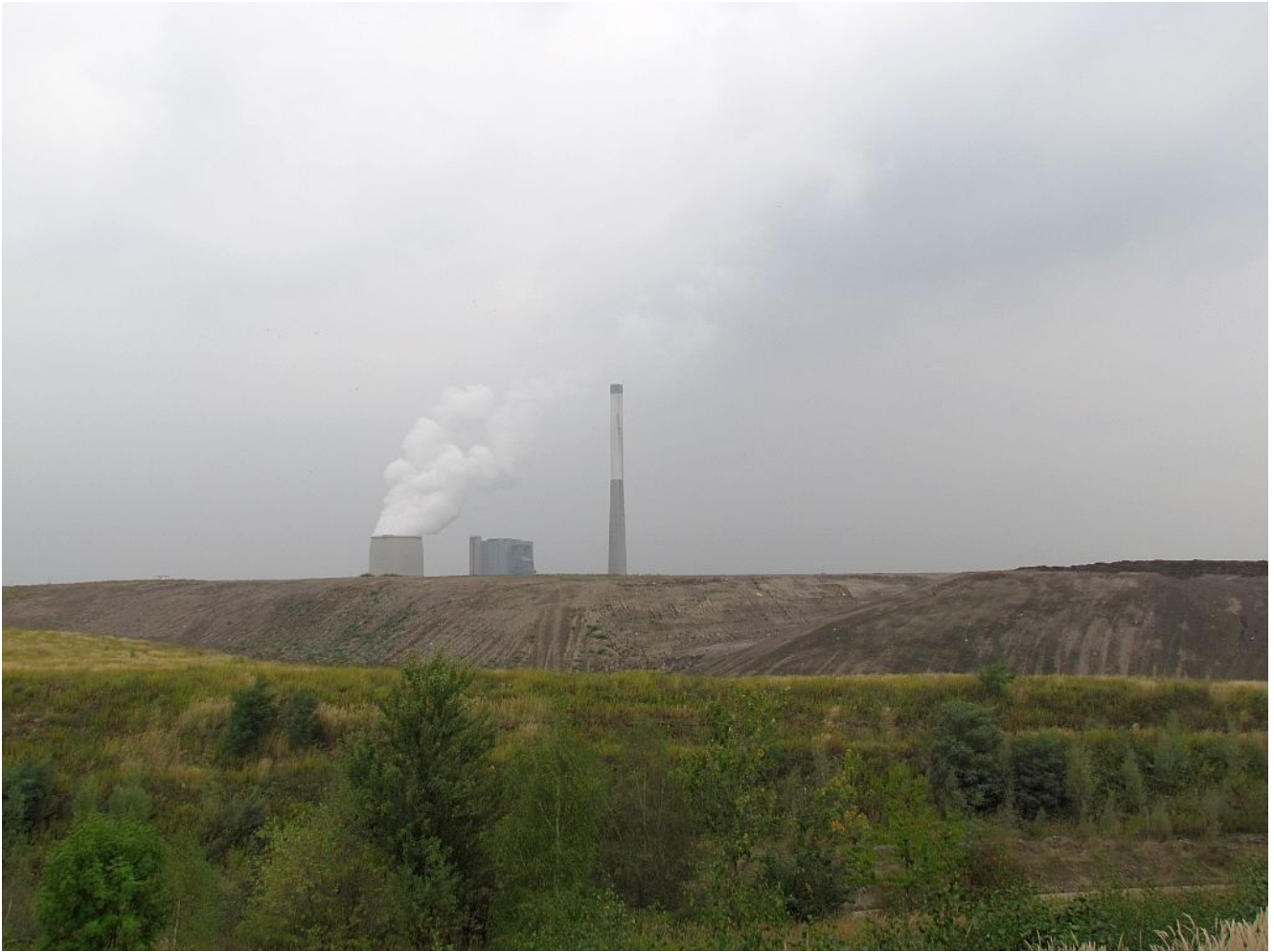
Haldenpanorama mit Kraftwerk