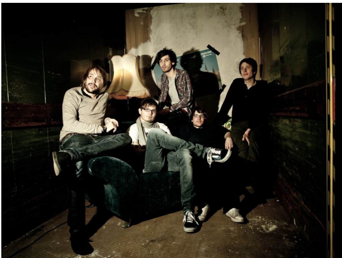
NOTHING BUT RASCALS

Am Freitag, 23. Mai, heißt das Konzertmotto wieder einmal „Mixed Tunes“, gemischte Livetöne im Jugendzentrum Yellowstone. Fünf interessante Bands aus den Bereichen Alternative, Indiepop, Hardcore, Metal und Punk werden den Abend bestreiten.