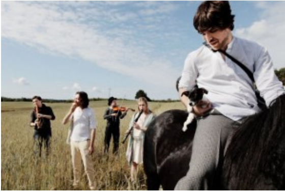
Die Gruppe „Spark“

Die fünfköpfige Gruppe Spark zählt zu den Senkrechtstartern der internationalen Klassikszene. Innerhalb kürzester Zeit hat sich das 2007 gegründete Ensemble vom exotischen Geheimtipp zu einem der vielversprechendsten Acts der jungen Generation entwickelt. Im Jahr 2011 erhält die klassische Band für ihr erstes Album Downtown Illusions den ECHO Klassik in der Kategorie „Klassik ohne Grenzen“.