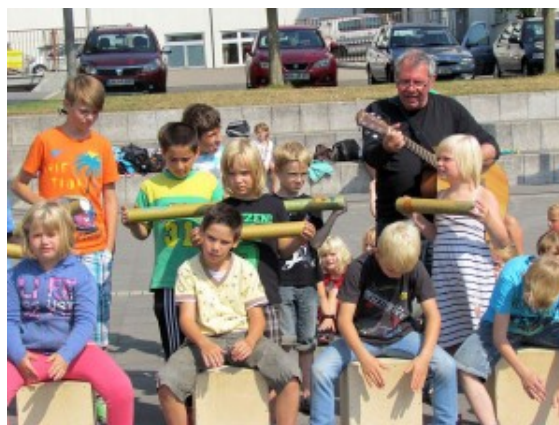
Kinderkulturtage im Wasserpark