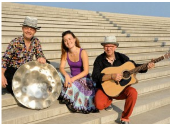
Das Janina Trio

von 17.00 bis ca. 23.00 Uhr, Samstag, 19. Juli von 15.00 bis ca. 23.00 Uhr und am Sonntag, 20. Juli von 12.00 bis ca. 18.00 Uhr