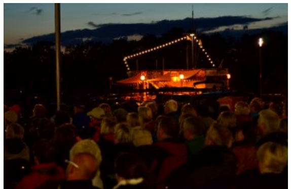
Das bunt gemischte Publikum vor maritimer Kulisse.

Dazu trug auch der großartige Film bei, der diesmal mit digitaler Technik anstelle der zuletzt schon traditionellen Filmrolle über die Leinwand flimmerte. Wenn mit dem Tunichgut Driss und dem querschnittsgelähmten Philippe zwei Welten aufeinanderprallen, wurde jedem trotz heftig gesunkener Temperaturen warm ums Herz. Das Publikum entdeckte zusammen mit den beiden Hauptfiguren neue Welten, warf manches Vorurteil über Bord, litt und freute sich mit in ebenso witzigen wie todernsten Szenen des Film „Ziemlich beste Freunde“.