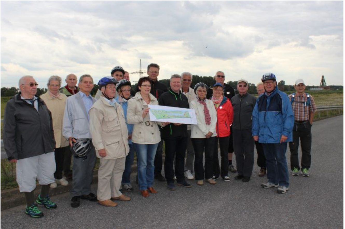
Gruppenbild auf dem Gelände der künftigen Wasserstadt Aden