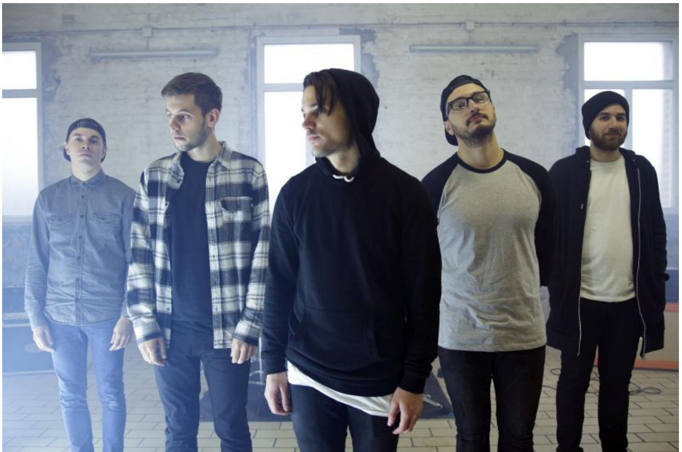
Stay Gone aus Lille/Frankreich

Am Freitag, 11. März, darf im Soundclub Yellowstone wieder das Tanzbein geschwungen werden. Schon zum zweiten Mal findet die Konzertserie „Herr Brückner lädt zum Tanz“ statt. Das Konzert wird in Zusammenarbeit mit Jugendlichen im Rahmen des Workshops „Konzertgruppe“ in Kooperation mit der Jugendkunstschule Bergkamen und Horror Business Records organisiert.