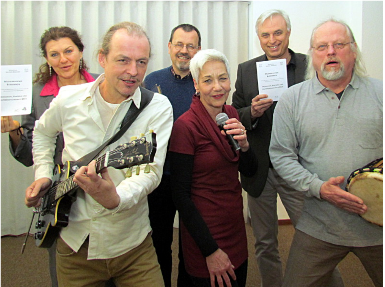
Die Dozenten der Bergkamener Musikakademie.