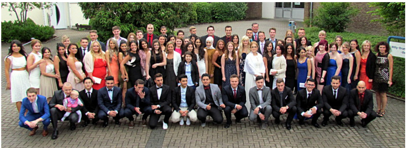
Abi-Jahrgang 2015 der Willy-Brandt-Gesamtschule