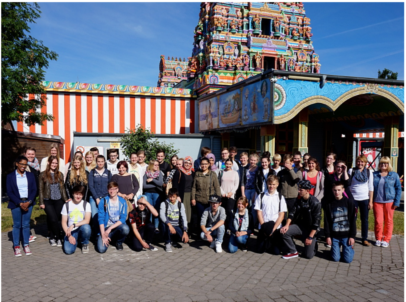
Bergkamener Gesamtschüler besuchten den Hindu-Tempel in Hamm