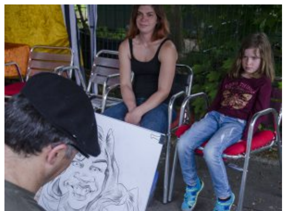
In irrer Geschwindigkeit

Überhaupt war beim 1. Straßenfest der Kleinkunst vieles einfach zu schnell für ganz normale Augen. Da überschlugen sich Diaboli in rasanten Luftsprüngen, wirbelten Teller im Himmel, flogen Bälle und Keulen in rasendem Tempo. Auch Lisa stellte sich auf der „Bunten Wiese“ vor dem Kinder- und Jugendhaus Balu in den Kreis, der sich gebildet hatte, und versuchte sich tapfer am Holzstab mit dazugehörigem Teller. Immer wenn der Lehrer wegschaute, drehte sich der Teller beeindruckend. Immer wenn er zu ihr kam, fiel er zu Boden. „Das funktioniert eigentlich ganz gut“, meinte die 16-Jährige deshalb unverdrossen und genoss den Spaß. „Ich bin einfach mal vorbeigekommen, um alles auszuprobieren“, erzählte sie. Sie ist im Karnevalsverein und dort braucht man schließlich auch eine gute Portion Talent für Akrobatik. Das hier hat sie allerdings alles tatsächlich noch nie ausprobiert.