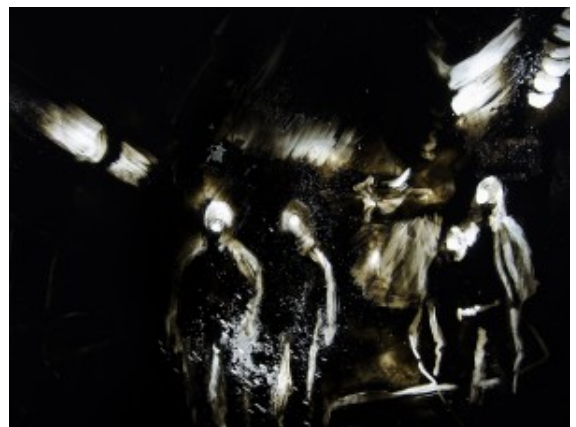
Silhouetten im Schacht – ein Ausschnitt aus einem Kunstwerk.

„Für die Bergkamener ist die Bergbauvergangenheit noch immer präsent – mit dem letzten Schachtgerüst, mit Bergsenkungen, vor allem aber mit dem ganz besonderen Zusammengehörigkeitsgefühl“, so der Beigeordnete Holger Lachmann zur Ausstellungseröffnung. Die Bezüge zur Stadt finden sich aber auch in der Lichtkunst, die hier eine große Rolle spielt. Auch an Aktualität mangelt es nicht, hat doch just die vorletzte Zeche im Ruhrgebiet die Förderung eingestellt.