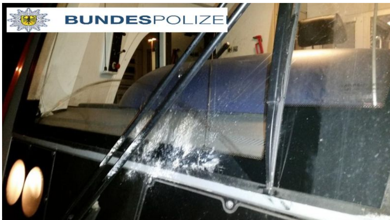
Die zerstörte Frontscheibe des RE6.

Mit vermutlich Steinen bewarfen bislang unbekannte Täter den RE 6, im Bereich der Bahnstrecke an der Robert-Koch-Straße, in Methler. Hierdurch wurde die Frontscheibe des Triebfahrzeugs beschädigt.