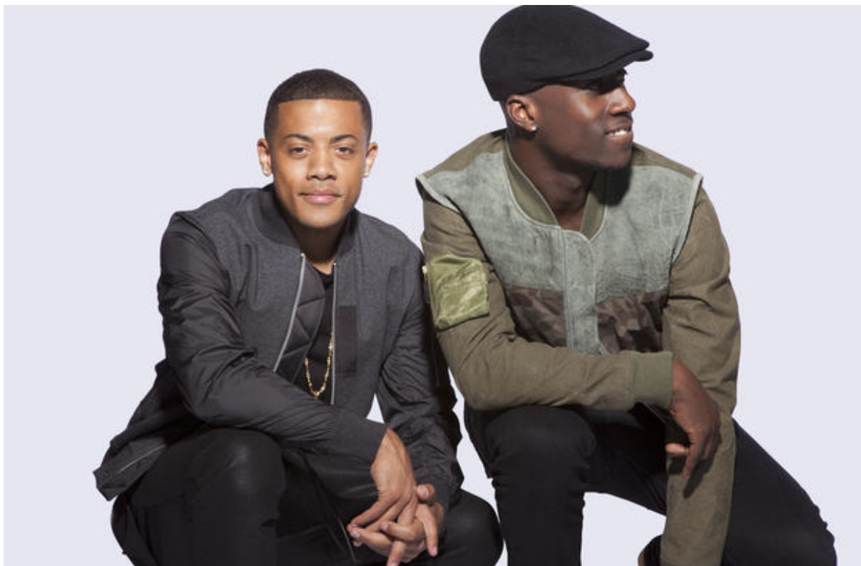
Nico & Vinz