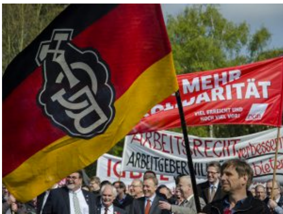
Mit wehenden Fahnen in Bewegung.

Bei prachtvollem Maiwetter hatte sich wieder eine stattliche Demonstrationsgemeinschaft auf dem Museumsplatz eingefunden. Mehr als noch im Jahr zuvor wollen für das Motto von „mehr Solidarität“ auf die Straße gehen. Zu „einer der größten