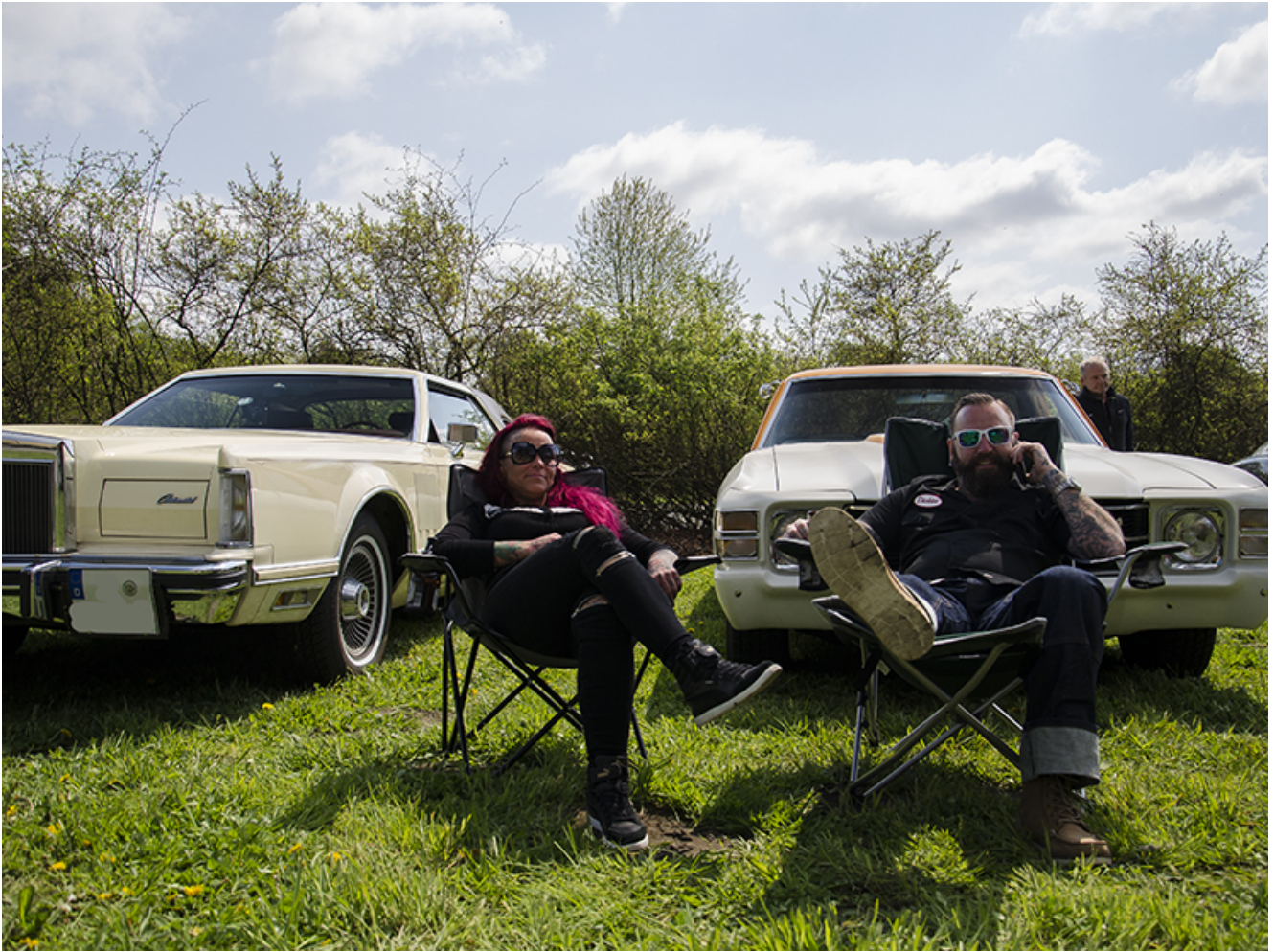
Ein Platz an der Sonne vor dem eigenen Oldie auf Hof Keinemann.