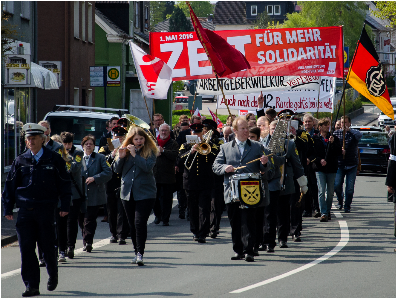
Traditioneller Demonstrationzug vom Museumsplatz zur Römerbergsporthalle.