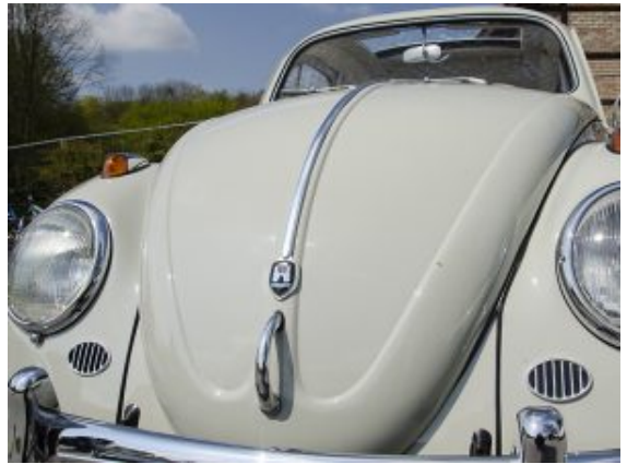
Augenschmaus für Käferfans.

Er fand den Winzling mit Spitznamen „Topolino“ schon immer „knuffig“. Als sich ein Kollege als heimlicher Besitzer eines solchen Schätzchens entpuppte, ließ er nicht locker. Viereinhalb Liter Verbrauch, Zwischengas und Kupplung, Gepäckträger samt Koffer aus dem Internet und das Modell in der Originalfarbe nachgespritzt in der Heckscheibe: Für ihn ist ein Traum in Erfüllung gegangen. „Wenn ich damit durch Oberaden fahre, bleiben die meisten stehen und schauen“, erzählt er. Gleichzeitig ist der Zwerg eine Wertanlage, schon jetzt fast doppelt so viel wert. Einzig die 18 PS stören ein wenig. Der neue Motor liegt aus Sportausgabe mit 50 PS schon bereit.