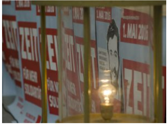
Symbolik am Rande.

Wer 45 Jahre gearbeitet hat, muss davon leben können. Oppermann will keine Verschiebung der Rentenaltersgrenze, fordert eine Stabilisierung des Rentenniveaus. Das könne aber nur seriös erarbeitet werden, „und das werden wir tun“ – etwa mit der Forderung nach einer Solidarrente, einer Reform der Betriebsrenten, Verbesserung der Riesterrente. Wichtig ist Oppermann, dass an den Ursachen gearbeitet wird. Die Defizite im Bildungssystem müssen beseitigt werden, es brauche Nachqualifizierungen, eine Gleichwertigkeit von akademischer und beruflicher Ausbildung, Chancen für alle.