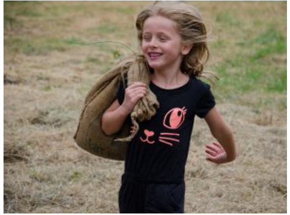
Vollgas beim „Airbag-Run“ der Mini-Highlandgames.