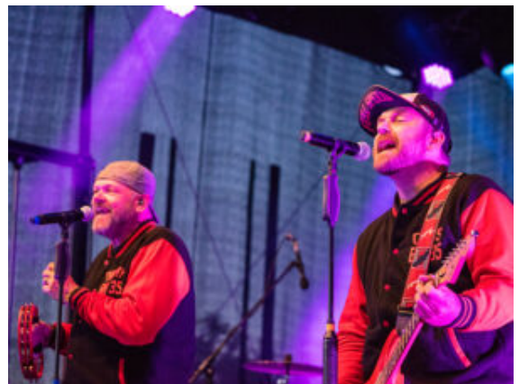
„Burning Heart“ bringt die Menge zum Kochen.

Es gab aber auch besinnliche Momente. Etwa bei der Taufe des „Roten Johannes“, dem neuen Boot der DLRG. Nach über 30 Jahren hatte das alte Schiff unwiderruflich ausgedient. GSW und Stadt steuerten zu der Anschaffung eines neuen Exemplars bei, damit vor allem in der Marina alle sicher unterwegs sein können. Eingeweiht wurde das neue Boot gleich vor Ort mit einem christlichen Kurzgottesdienst, Segnung, klassischer Bootstaufe durch Bürgermeister und GSW-Chef und der Jungfernfahrt mit anschließenden Rundfahrten. Auch der Tauchcontainer bot entschleunigende Anblicke beim Auftritt der „Mermaids“, die mit Meerjungfrauenflosse elegant an den Scheiben vorbeiglitten oder DLRG-Retter, die in aller Ruhe mit voller Tauchausrüstung eine Bergung bewältigten.