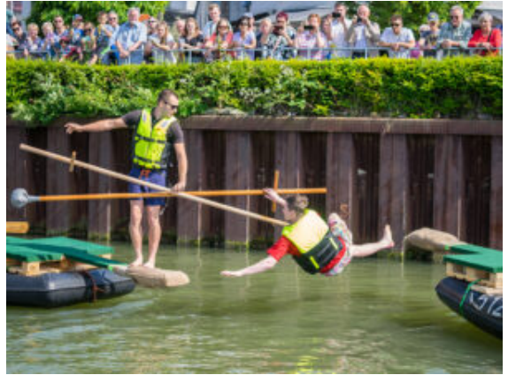
Action beim Fischerstechen im Hafenbecken.

Das Fischerstechen hat immer noch seinen Reiz: Acht Mannschaften traten beim Balanceakt auf der Rampe an der Bootsspitze mit gepolsterten Lanzen gegeneinander an. Das Flying Board war heiß begehrt, um sich mit gewaltigen Wasserdüsen in die Höhe zu schießen. Die Powerboote auf der anderen Hafenseite waren schon fast zu schnell, um ihnen mit dem bloßen Auge zu folgen. Auch in der Kinderunterhaltung ging es ganz schön rasant zu. Mit Bungee-Seilen schossen die Kinder unablässig in die Höhe, feuerten Bälle im Piratennest aus der Kanone ins Ziel oder tanzten sich mit den Akteuren auf der Bühne klitschnass im Takt nass.