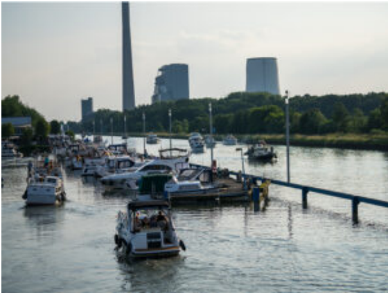
Die Boote bei der Einfahrt in die Marina.

bieten, was zu einem fast sommerlich-maritimen Festauftakt gehört. Die Sonne gab jedenfalls alles und bot eine farbsatte Kulisse mit stattlichem Sonnenuntergang bei deutlich erwärmten Temperaturen. Endlich kamen T-Shirts und Sandalen zum Einsatz, auch für ein spontanes Tänzchen direkt vor der Bühne.