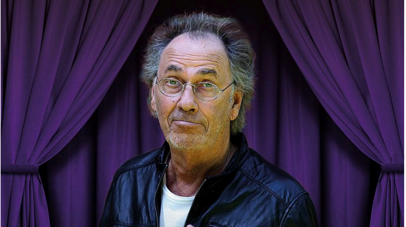
Hugo Egon Balder.

Der deutsche Fernsehmoderator, Fernsehproduzent, Musiker, Schauspieler und Kabarettist Hugo Egon Balder ist mit seinem ersten Solo-Programms „Erzählt es bloß nicht weiter!!“ unterwegs und macht auch in Bergkamen Halt!