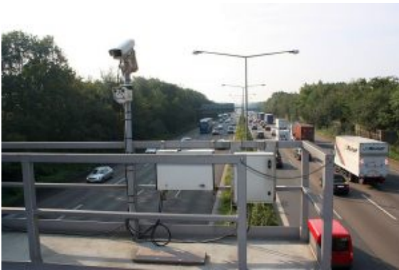
Webcam an der A1.

Bergkamen liegt ja im Schnittpunkt zweier Autobahnen recht verkehrsgünstig. Doch was nutzt das, wenn es sich auf der Piste staut. Einen aktuellen Überblick verschaffen Webcams, die unter anderen an den neuralgischen Autobahnkreuzen Dortmund Nordost an der A2 und Dortmund Straßen.