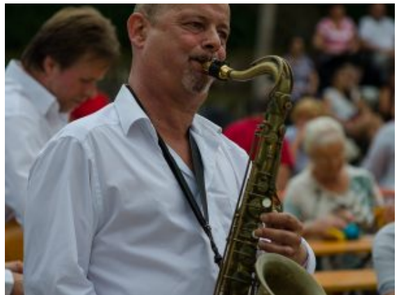
Mitreißende Klänge von der Band „Kabellos“.

heimische Schauspiel-Talente reserviert. Drei Monate hatten die Nachwuchs-Truppe der Volksbühne 20 im Yellowstone in Oberaden für diesen großen Auftritt geprobt. Eine tolle Chance für „Spotlight“, denn derart große Aufmerksamkeit gibt es selten. Mit zwei Aufführungen hatten sie sich im Vorfeld bereits vor kleinerem Publikum „warmgespielt“. Als sich der Wasserpark stetig füllte, war immer noch kaum Nervosität hinter der Bühne zu spüren.