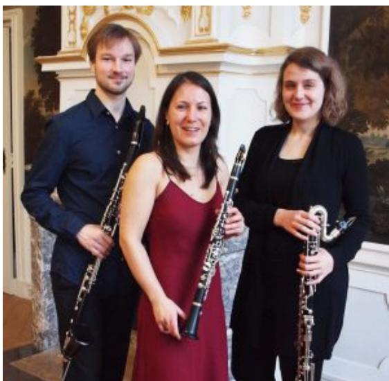
Das Klarinettenrio Schmuck. – Foto: Yumi Schmuck

Die Reihe der Kammermusiken auf Haus Opherdicke wird am Donnerstag, 19. Januar fortgesetzt. Das Klarinettenrio Schmuck gastiert an diesem Abend auf dem kreiseigenen Gut. Das Konzert beginnt um 20 Uhr im Spiegelsaal von Haus Opherdicke an der Dorfstraße 29 in Holzwickede. Einlass ist ab 19 Uhr.