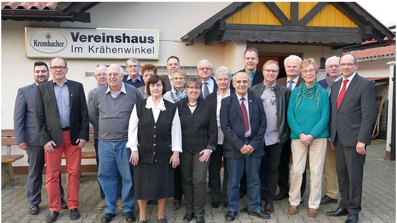
Die Jubilare des SPD-Ortsvereins Weddinghofen.