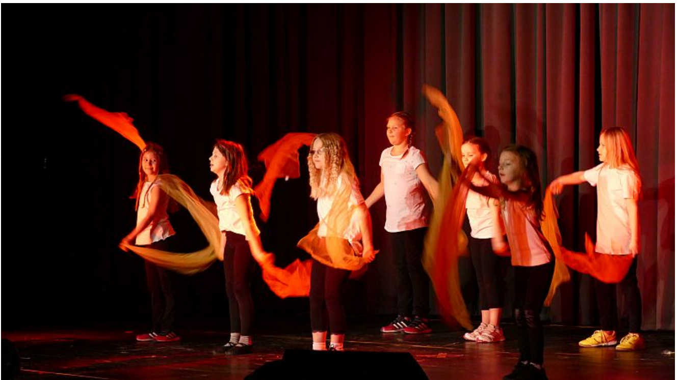
Die neue Tanz-AG der Schillerschule.