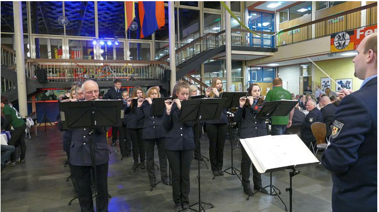
Der Spielmannszug der Bergkamener Feuerwehr.