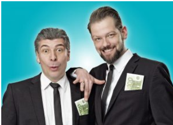
Satire-Duo Onkel Fisch.