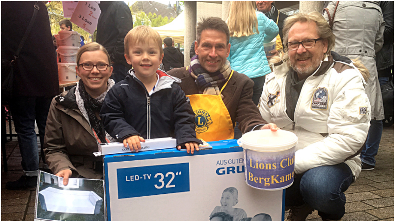
Lions-Tombola auf dem Frühlingsmarkt 2016.

Und natürlich locken am kommenden Wochenende wieder jede Menge tolle Preise, die das Mitmachen auch lohnen – wie zwei Markenfernseher von Grundig 40 und 32 Zoll groß, ein Tablet-PC von Samsung, eine Micro-Hifi-Anlage, ein Kaffeeautomat, ein Einrad, zwei Radio-CD-Geräte, ein elektrischer Standkamin, ein Werkzeugkoffer, Garten- und Haushaltsgeräte und Unterhaltungselektronik Insgesamt haben die Lions über 1200 Preise zusammengetragen – darunter zehn wertvolle Hauptpreise – da sind die Chancen auf einen Gewinn wie immer sehr groß.