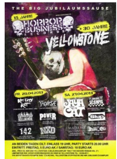
Plakat zur Doppeljubiläumsparty im Yellowstone

30 Jahre alt wird das Oberadener Jugendzentrum Yellowstone und das Selmer Label „Horror Business Records“ 15 Jahre. Grund genug, dies mit einer zweitägigen Geburtstagsfeier am letzten April-Wochenende zu feiern.