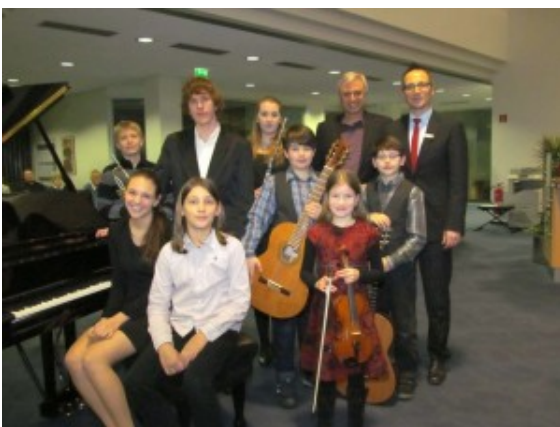
Die Teilnehmer des Preisträgerkonzerts von „Jugend musiziert“.