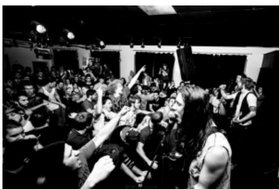
The Hunters vor Publikum

Das Konzertmotto heißt am Freitag, 15. März, im Jugendzentrum Yellowstone wieder einmal „Mixed Tunes“. Gemischte Livetöne aus den Bereichen Punkrock, Emo, Folk, Hardcore und Alternative. Das Team des Jugendzentrums und das Independent-Label „Horror Business Records“ laden zu einem runden Musikabend.