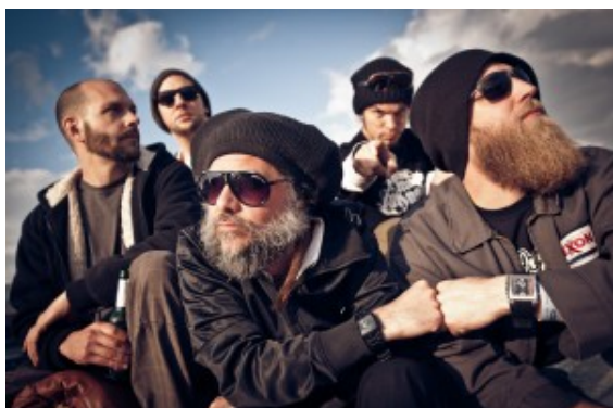
JAYA THE CAT

Folgende Bands werden am Freitag, 4. Oktober zu sehen uns zu hören sein: