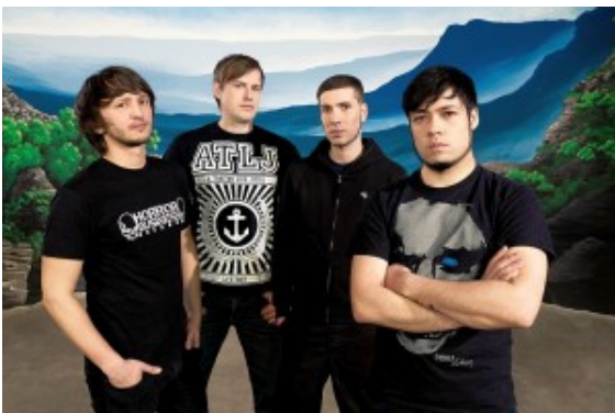
DISTANCE IN EMBRACE

Das Motto „Get Loud“ und eine ganze gitarrenjaulende Nacht beweisen: Es lohnt sich, für die Jugendkultur Krach zu schlagen! Der Eintritt zu dieser Veranstaltung ist frei! Die Anmeldung zum Fotoworkshop erfolgt am Veranstaltungstag vor Ort.