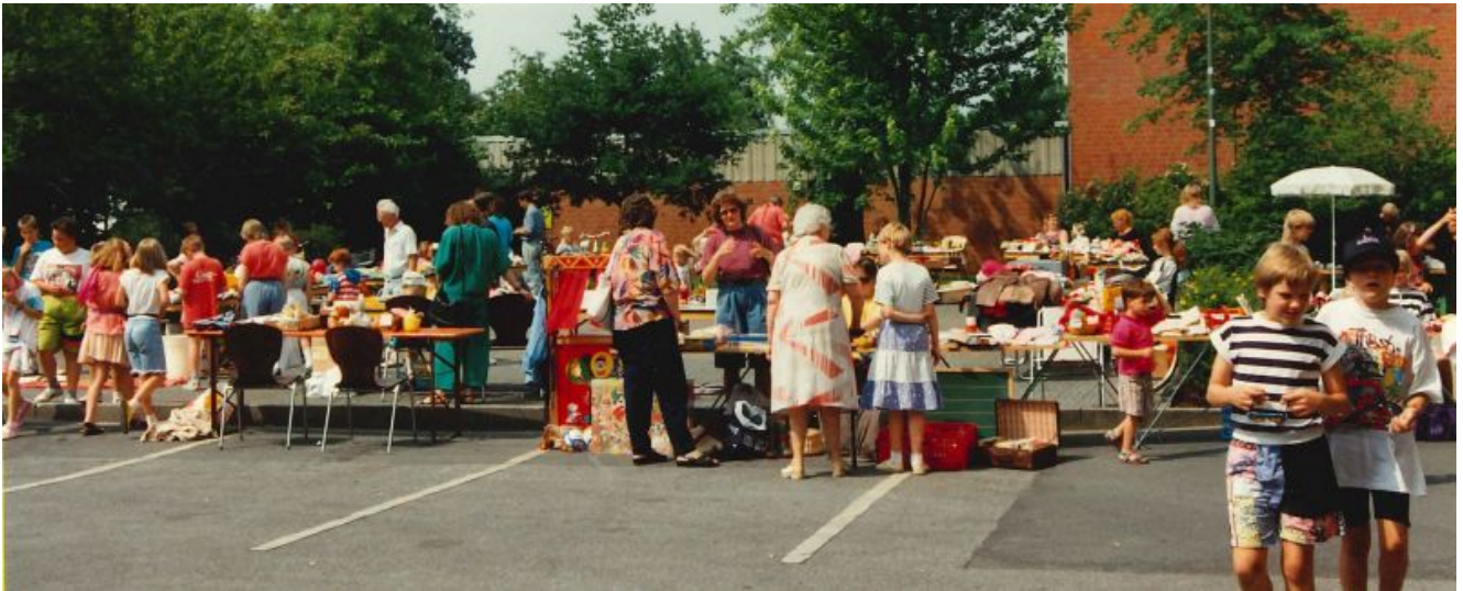
Kindertrödelmarkt am Yellowstone im Juni 1992