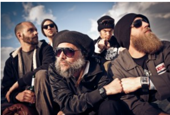
JAYA THE CAT

Am letzten Aprilwochenende wird in Bergkamen zwei Tage lang gefeiert was das Zeug hält. Das JZ Yellowstone im Stadtteil Oberaden wird 30 Jahre und Horror Business Records wird 15 Jahre alt.