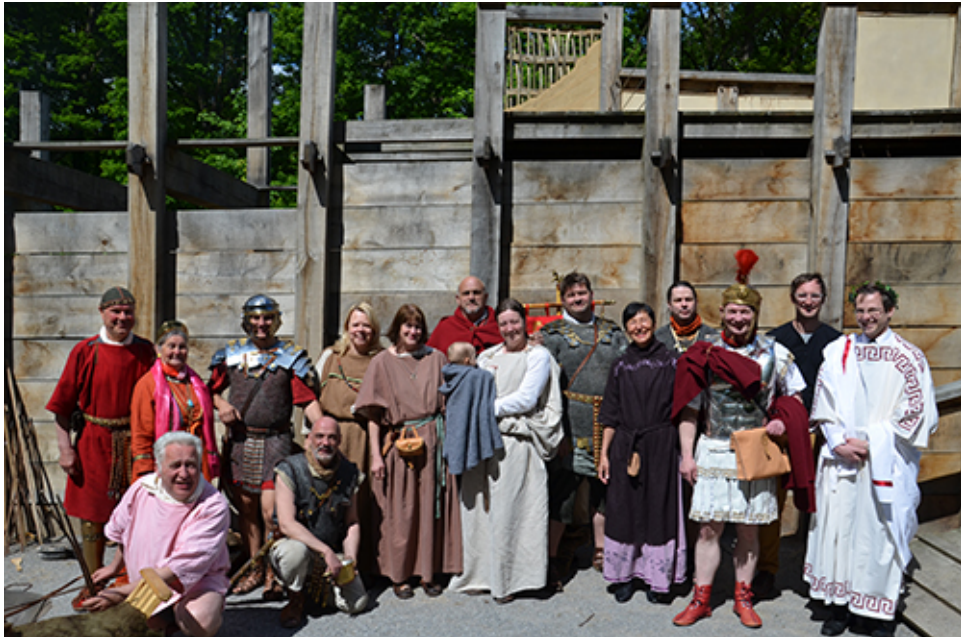
Die Lagerbevölkerung auf einen Blick.