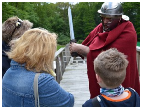
Mit dem Schwert zum Nahangriff.