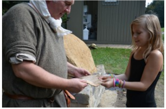
Gemeinsam wird der Fladen geformt.

Wieder wird die kleine Ofenpforte geöffnet. Dichter Rauch dringt heraus. Auf Holzbrettern wird der Flammkuchen der anderen Art in den dunklen Ofenbauch geschoben. Knapp 10 Minuten später ist auch dieses Experiment gelungen. „Köstlich!“, rufen auch die Eltern der Römer-Lehrlinge, die ebenfalls zum Ofen-Eröffnung eingeladen sind. Die römischen Kelche machen jetzt die Runde. Rund um die Holz-Erde-Mauer flammen wieder heftige Kämpfe auf. Römische Trinksprüche gehen von Mund zu Mund. Die frischen Waffeln, die den Gabentisch bereichern, bekommen kurzerhand einen römischen Namen.