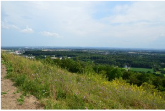
Die Bergkamener Halde.

Um 10 Uhr startet die Tour an diesem Tag unter der Leitung von Gästeführerin Elke Böinghoff-Richter auf dem fest ausgebauten erweiterten Wanderparkplatz unterhalb der „Adener Höhe“ an der Erich-Ollenhauer-Straße in Bergkamen-Weddinghofen (Parkmöglichkeiten auch an der Straße Binsenheide).