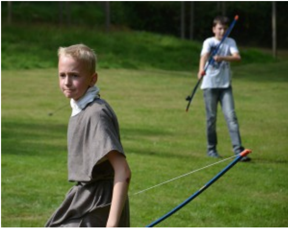
Römische Bogenschützen im Einsatz.

„Hmmm, lecker!“ Das Lob kennt keine Grenzen. Auch das gute Dutzend Kinder, das den Ofen auf dem Gelände der Holz-Erde-Mauer vor wenigen Wochen mit eigenen Händen gemauert hat, klemmt sich bei der Erstürmung der Lagerbefestigung ein warmes Brötchen zwischen die Zähne. Schließlich muss zur offiziellen Ofeneinweihung auch stilecht gekämpft werden. Wie das funktioniert, haben sie parallel zum Ofenbau im Drusus-Camp des Stadtmuseums gelernt. Sogar die Tunika lässt sich mancher nicht nehmen, wenn er mit (entschärften) Pfeilen die Legionäre auf der Mauerkrone oder Asterix und die Wildschweine auf den Holzplatten hinter dem Spitzgraben ins Visier nimmt. Schließlich haben echte Römer den jungen Soldaten das Exerzieren beigebracht.