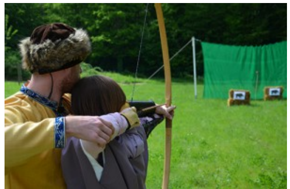
Zielgenauigkeit war bei den Römern auch mit Pfeil und Bogen gefragt.