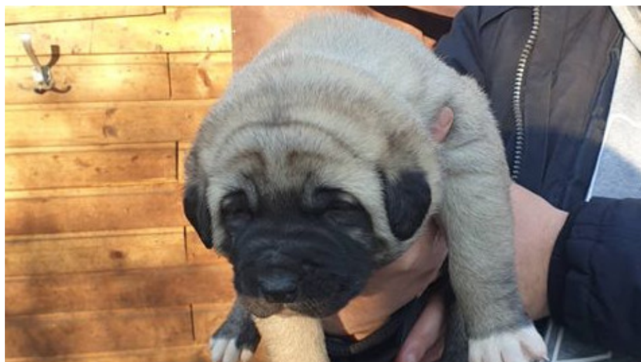
Das ist der männliche Welpen.

Zwei Hundewelpen sind von Montag, 18.00 Uhr, auf Dienstag, 11.00 Uhr, aus einem Schrebergarten an der Ernst-Schering-Straße in Bergkamen-Mitte gestohlen worden. Es handelt sich um zwei hellbraune Anatolische Hirtenhunde (Kangal). Beide Tiere – ein Männchen und ein Weibchen – waren noch nicht gechippt. Der Besitzer ist ein 31-jähriger Kamener.