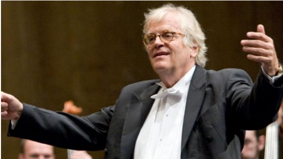
Professor Justus Frantz.

. Gefördert wird sie von der Sparkasse Bergkamen-Bönen, GSW, den Gemeinschaftsstadtwerke GmbH Kamen, Bönen, Bergkamen und der Bayer AG