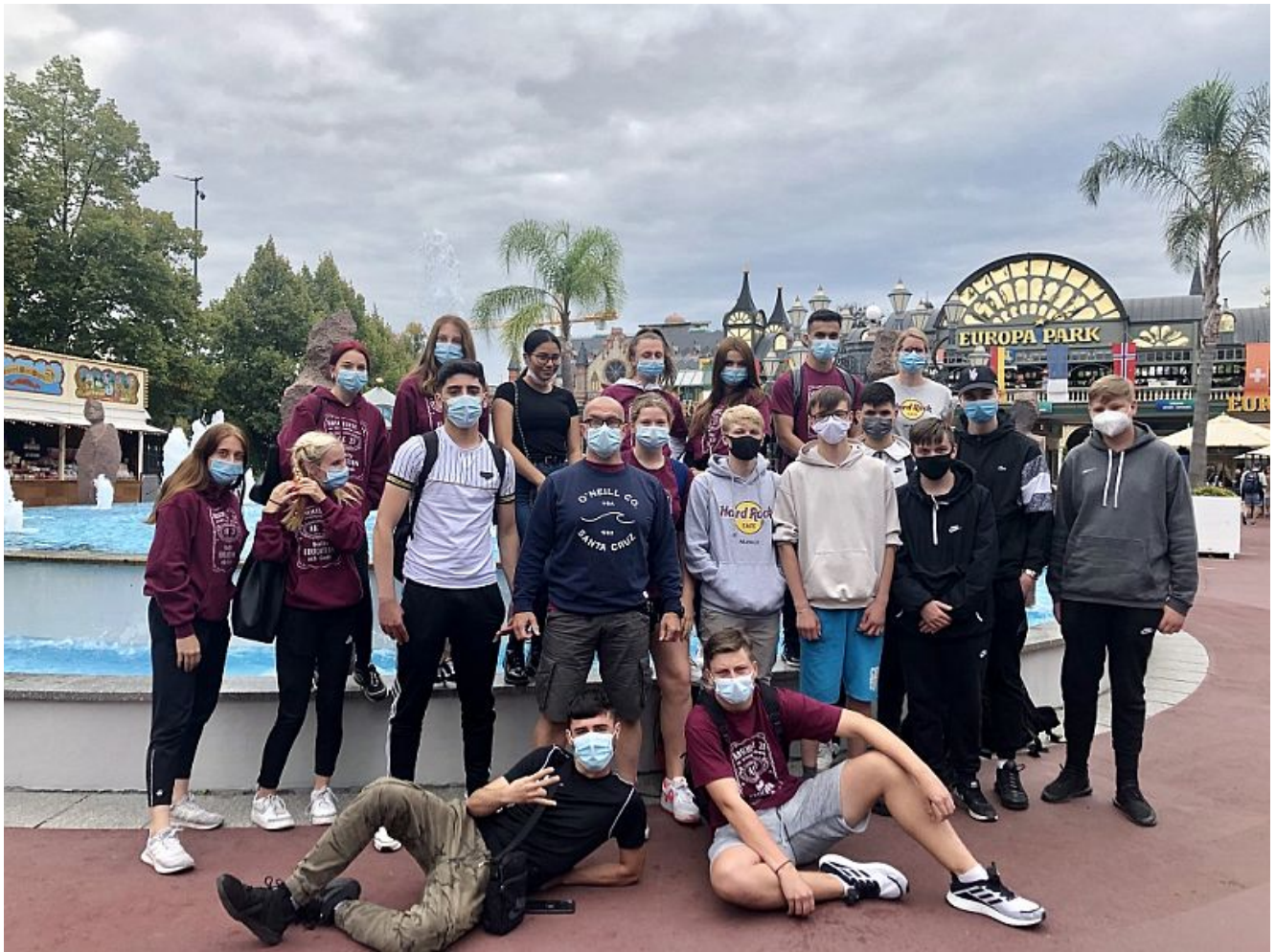
Die 10a fuhr nach München.

von außen betrachtet werden durfte, erhielten die Schülerinnen und Schüler einen guten Eindruck. Zudem wurde das ehemalige Konzentrationslager Ravensbrück besucht.