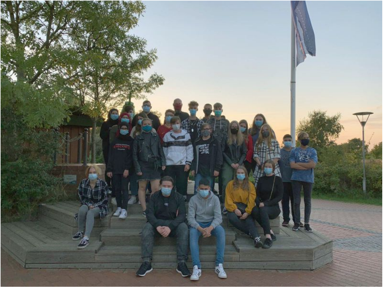
Der Weissenhäuser Strand war das Ziel der 10b.

Land NRW verlängert Coronaschutzverordnung: Mehr Zuschauer bei Sportveranstaltungen