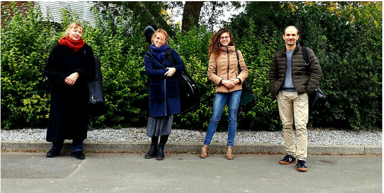
Streichquartett Capella Pergolesi.

Obwohl das gemeinsame Reformationsfest der beiden Ev. Kirchengemeinden Bergkamen am Samstag, 31. Oktober, unter dem Motto steht „Reformationstag gestrichen“, handelt es sich um keine Absage, sondern um einen Hinweis auf die besondere musikalische Gestaltung durch das Streichquartett Capella Pergolesi.