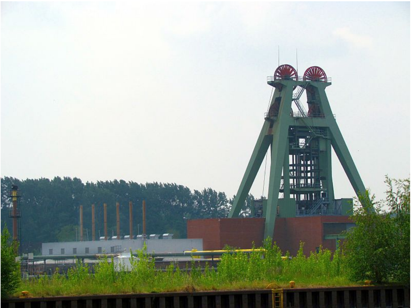
Das Schachtgerüst Haus Aden 2 .