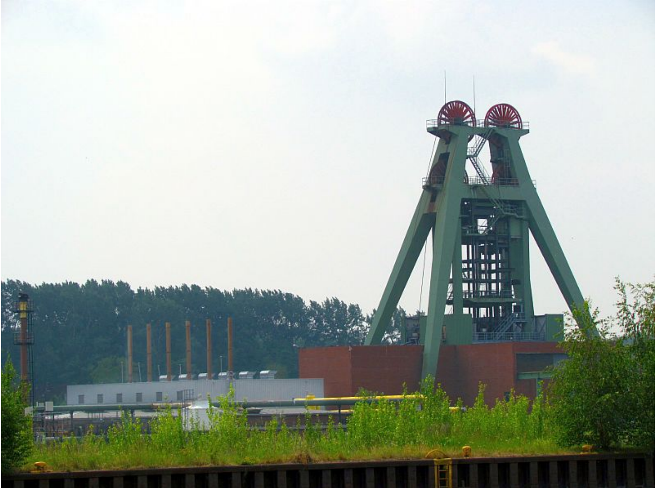
Das Schachtgerüst Haus Aden 2 .

Vielleicht schon ab Ende Februar wird das Schachtgerüst Haus Aden 2 aus dem Stadtbild verschwinden. Hier hat es die RAG eilig, denn bekanntlich soll auf dem Fundament des Förderturms die neue Wasserhaltung für das östliche Revier gesetzt werden.