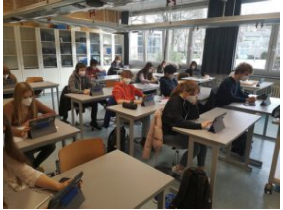
Die neuen iPads des Gymnasiums im schulischen Einsatz.

Mit Blick auf den Pferdefleischskandal konnten die Teilnehmenden Wurstproben und die darin enthaltenden Tierarten mittels DNA-Fingerprinting voneinander unterscheiden und im Rahmen des Experimentierkurses herausfinden, welche Tierart(en) in dieser Probe verwertet wurde(n). Alle Schülerinnen und Schüler nahmen per Videokonferenz live am Geschehen im Labor teil und konnte die dort gezeigten Schritte zuvor durch Animationen im Onlinelabor selbst durchführen. Erstmals kamen dabei die neuen iPads der Schule zum Einsatz. Der Leistungskurs bedankt sich ausdrücklich bei dem Laborteam der Universität Bielefeld und kann feststellen: In der Mortadella ist wirklich nur Schweinefleisch.