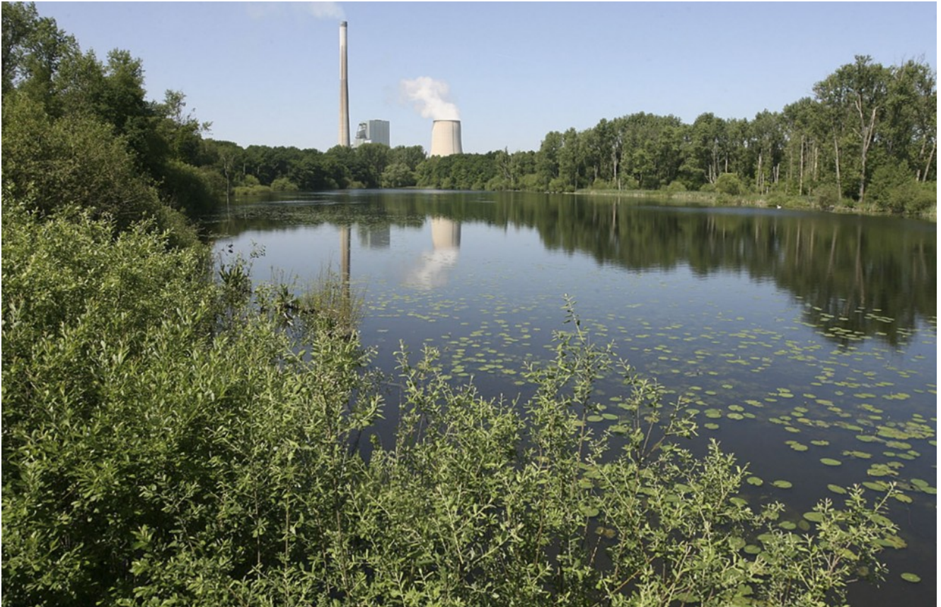
Das Naturschutzgebiet Beversee.

Ein Ausflug ins Grüne ist für viele eine Abwechslung vom grauen Corona-Alltag. Gerade jetzt im Frühling zieht es die Menschen raus in die Natur. In diesem Zusammenhang erinnert der Kreis Unna daran, dass in einigen Bereichen besondere Regeln gelten. Zum Beispiel in Naturschutzgebieten.