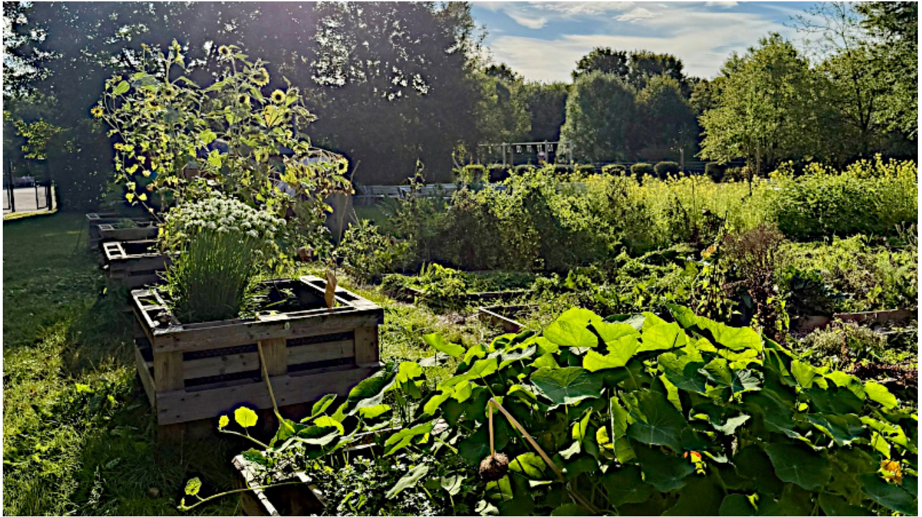
Der Schulgarten der Realschule Oberaden.

Auf dem Gelände der Realschule Oberaden hat sich in den vergangenen Jahren sichtbar vieles getan. Neben Investitionen in digitale Technik, neue Schülertoiletten und die Ausstattung der Unterrichtsräume fallen vor allem die zahlreichen Außenprojekte ins Auge, die bei Schülerschaft und Bevölkerung gleichermaßen auf Zuspruch stoßen.