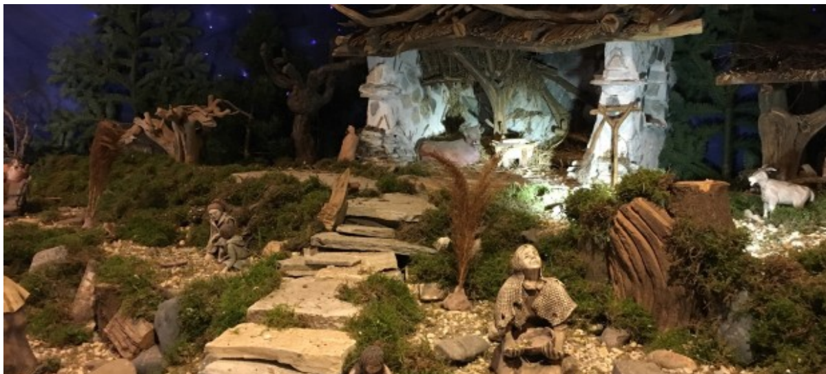
Krippenlandschaft in der Friedenskirche.

Die Friedenskirchengemeinde schließt sich der Empfehlung der Landeskirche an und wird ab sofort und über die Weihnachtsfeiertage – voraussichtlich – bis zum 10.01.2021 auf alle Präsenzgottesdienste und andere kirchliche Versammlungen (in Gebäuden und unter freiem Himmel) verzichten. Damit werden alle unsere Gottesdienste in den Kirchen oder auch draußen abgesagt.