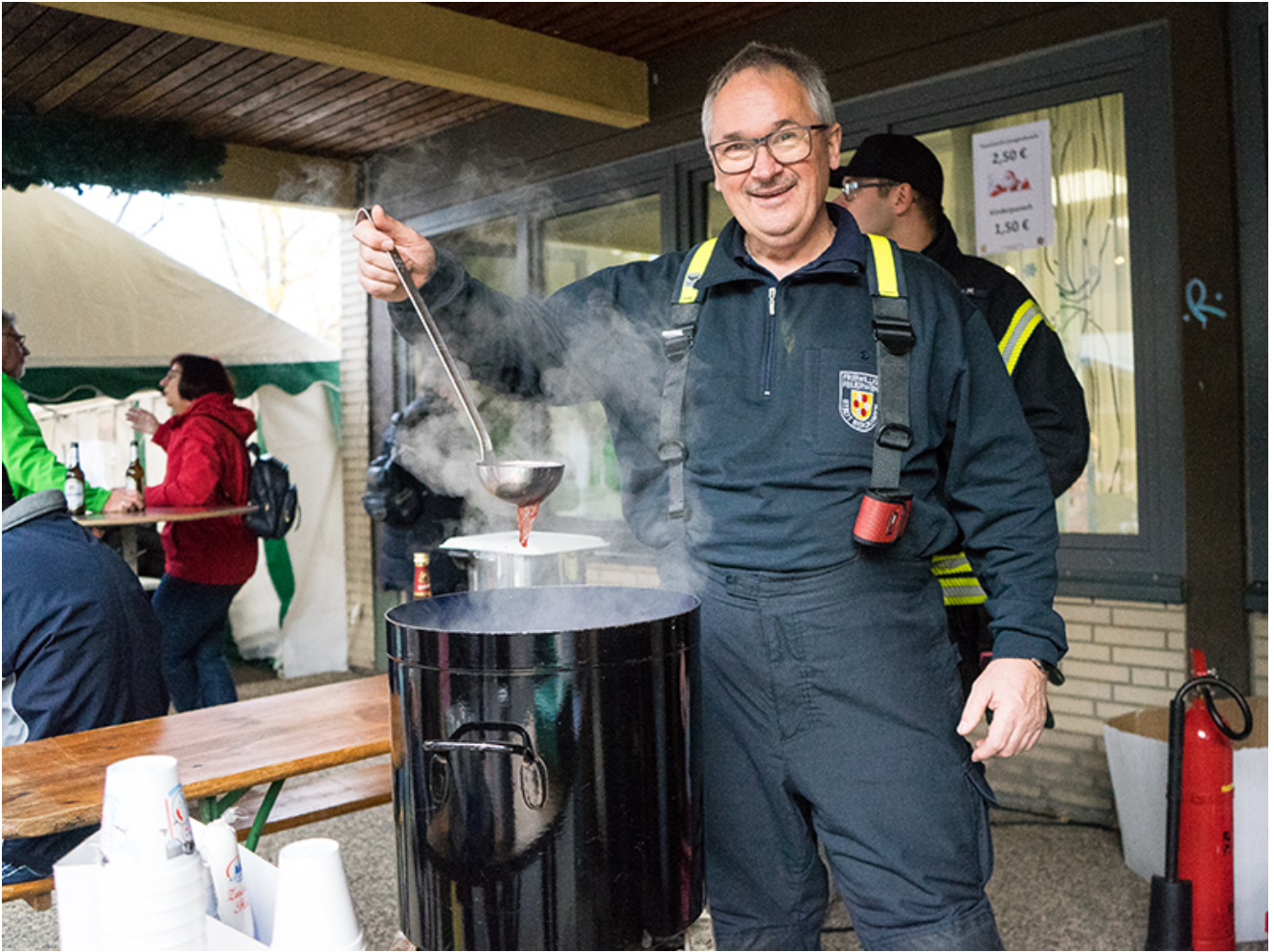
Unverzichtbar: Der Glühwein von der Feuerwehr.