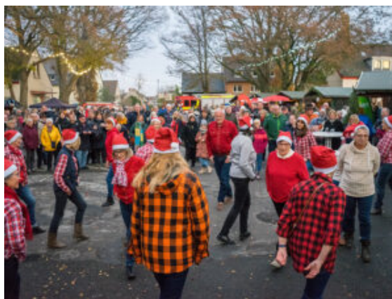
Tanzvorführung vor der Bühne.

Einmachglas hervor und ein Teelicht. Beides wird akkurat auf der Wiese neben der Kirche platziert. Kurz darauf brennen die Kerzen mit anderen in trauter Eintracht. Zwei Frauen beobachten das von der Bank aus haargenau. „Was machen die hier nur alle – und was soll das sein?“, fragen sie sich und betrachten stirnrunzelnd das Licht-Gebilde auf der Wiese. „Das ist doch das Peace-Symbol für den Frieden“, sagt jemand, der das Gespräch mitbekommt.