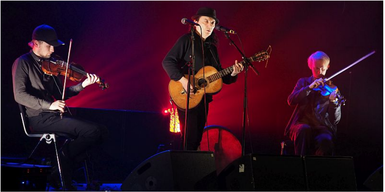
Torgeir Vassvik (m.).

Im Trauzimmer Marina Rünthe sorgt der nordsamische Soundpoet Torgeir Vassvik am Montag, 13. Februar, ab 20 Uhr für einen Frischekick von der Küste des arktischen Ozeans.