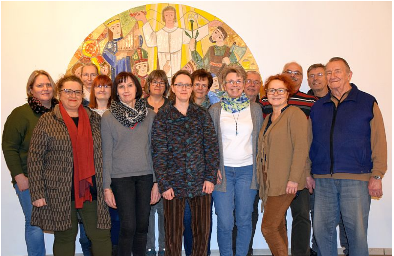
Kirchenchor Kreuz & Quer.

Den Chor Kreuz & Quer gibt es seit über 20 Jahren. Mit viel Freude und Herzblut gestaltet er mit seinem Gesang die Gottesdienste unserer Gemeinde in der Kirche St. Barbara in Bergkamen / Oberaden. Für die meisten Lieder reichen die Stimmen des kleinen, aber feinen Chors aus, aber manche Musik verlangt nach mehr Volumen, nach größerer Sängerzahl. Wie die Missa Popularis von Michael Schmoll, die der Chor in der dreistimmigen Fassung für Sopran, Alt und Männer singen will.